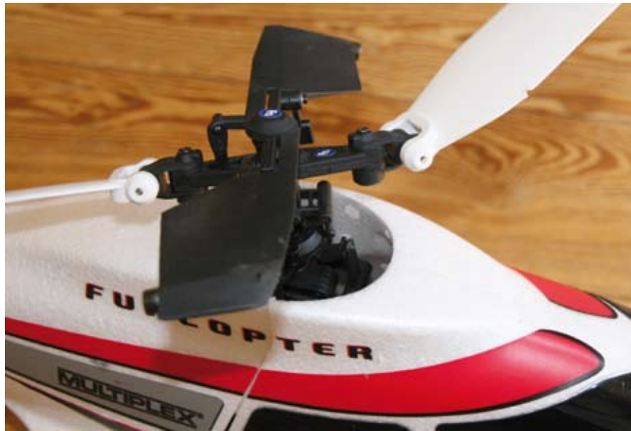
Um Schäden zu vermeiden, können sich die Rotorblätter nach oben wegklappen. Ist dies einmal der Fall, muss man sie lediglich wieder einrasten

„Ja, das ist der Funcopter, den gibt's wirklich!“, musste zuweilen dem einen oder anderen Bewunderer am Flugplatz auf seine Frage geantwortet werden. Doch die Entwicklungszeit hat sich gelohnt. Einsteiger haben mit diesem Heli ihre wahre Freude, denn kein Absturz beendet die Flugsession. Auch der härteste Einschlag konnte, bis auf die Servogetriebe, keinen Defekt hervorrufen. Das Konzept des unkaputtbaren Einsteigerhelis geht