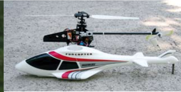
Die Rumpferkleidung kann man mit wenigen Handgriffen komplett abnehmen. Das ist jedoch nur nötig, möchte man an den Empfänger ran

Mit lediglich einem Knopfdruck lässt sich die Haube nach vorne abziehen. So kommt man bequem an das Equipment und kann bei Bedarf schnell eine Gestängelänge verändern