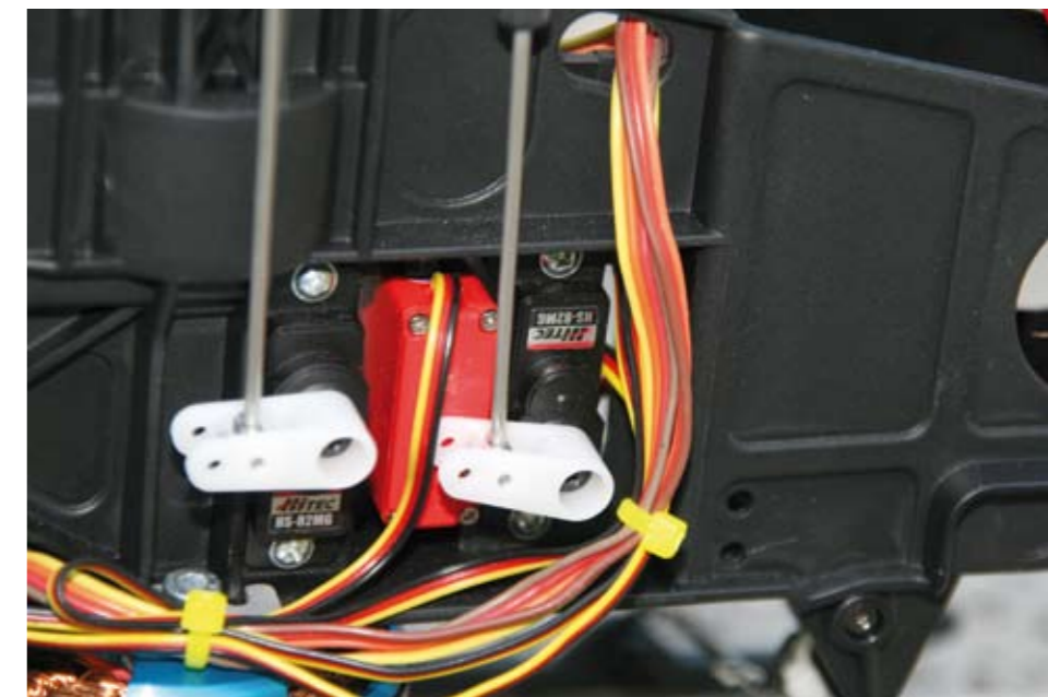
Nach den ersten härteren Abstürzen waren die Servogetriebe auf Roll und Nick defekt. Mit den HS-82, die Metallgetriebe besitzen, ist das vorbei

Schwammiges Heck Anfällige Servogetriebe der Tiny-S