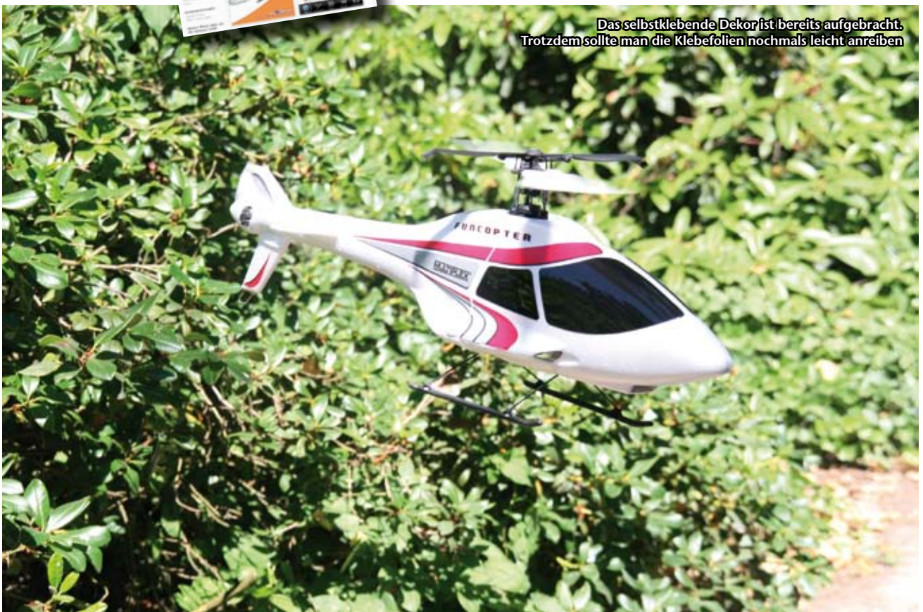
Das selbstklebende Dekor ist bereits aufgebracht. Trotzdem sollte man die Klebefolien nochmals leicht anreiben