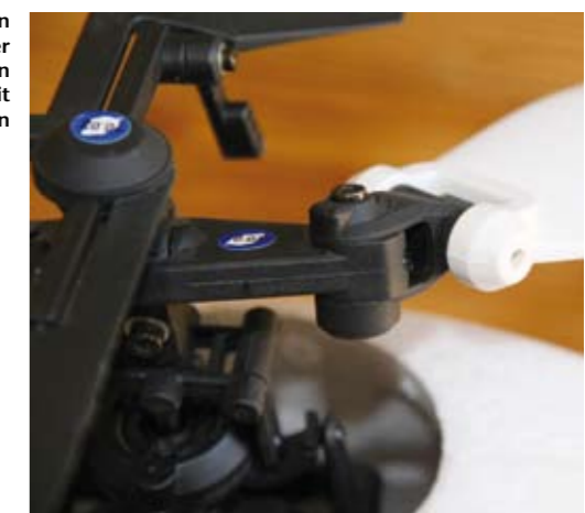
Die Rotorblätter schwenken sich beim Funcopter nicht wie üblich in den Blatthaltern, sondern mit zusätzlichen Gelenken

nun zu einem nahezu unzerstörbaren Heli führte. Klar, die Kufenbügel benötigten hin und wieder eine starke Hand, um sie wieder in die ursprüngliche Form zu biegen und ein Flügelchen des Heckauslegers mochte wieder angeklebt werden. Doch das alles hinderte nie an einem weiteren Flug. So konnte die bessere Hälfte Flug um Flug, Absturz um Absturz einige Akkus lang Erfahrungen sammeln und sich immer mehr an die neue Aufgabe gewöhnen. Am Ende war der Schwebeflug bereits gemeistert, nicht zuletzt dank des unglaublich einstecktfreudigen Funcopters,