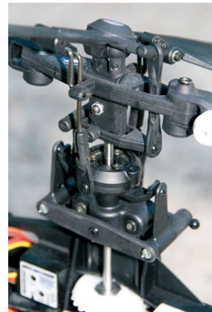
Der Rotorkopf glänzt vor allem mit Unzerstörbarkeit, jedoch nicht durch Spielfreiheit

Ja, tatsächlich steckte der Funcopter alle Gemeinheiten und Fisimatenten der Flugschülerin klaglos weg – sieht man mal von den Servogetrieben der Tiny-S ab. Diese Rudermaschinen wurden kurzerhand durch Hitec-HS 82 mit Metallgetriebe ausgetauscht, was