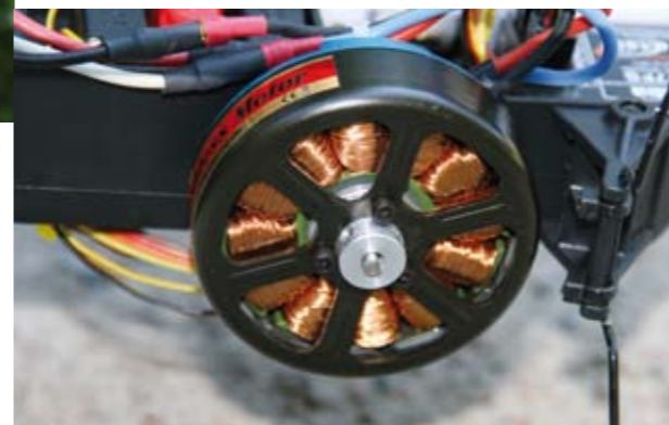
Der Brushless-Außenläufer sitzt direkt unter der Hauptrotorwelle und treibt den Hauptrotor direkt an. Der Controller besitzt offensichtlich eine spezielle Software, denn andere Regler hatten mit dem Motor große Anlaufprobleme

Der Funcopter besteht im Grunde aus einem schlagzähen Kunststoff-Chassis und der Außenhaut aus Elapor. Diese ist über das ganze „Skelett“ des Helis gestülpt und übernimmt neben der optischen Formgebung zudem die Funktion eines Schutzpanzers und einer Knautschzone. Das Chassis an sich ist aus wenigen Teilen kompromisslos auf „Einstecken“ aufgebaut. Der vordere Ausleger ragt relativ weit vor und nimmt vornehmlich 3s-LiPos mit 2.500 bis 3.200 Milliamperestunden Kapazität auf. Auch der Heckantrieb, beim Funcopter robuste Delrin-Kegelzahnräder, scheint für die Ewigkeit gebaut. Da wird schnell klar: Die Technik ist sehr robust. Ein Zahnriemen, wie er zurzeit in den meisten Fällen zum Antrieb des Heckrotors eingesetzt wird, gibt es nicht – auch wenn dieser die leisere Variante darstellen würde. Der Antrieb erfolgt vielmehr über einem Zwei-Millimeter-Federstahldraht, der im Heckrotor mit einem weiteren 90-Grad-Winkelgetriebe verbunden ist. Die Kufenbügel sind auch aus 2 Millimeter starkem Stahldraht zurechtgebogen und mit Kabelbindern in den Kunststoff-Kufen fixiert. Damit sollten selbst Stürze aus zwei Meter Höhe auf Rasen ohne bleibende Schäden verlaufen.