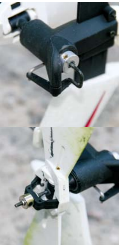
Der Heckrotor wird durch ein in einer Hohlwelle geführtes Pitchgestänge angesteuert. So lassen sich Teile, die brechen könnten, einsparen