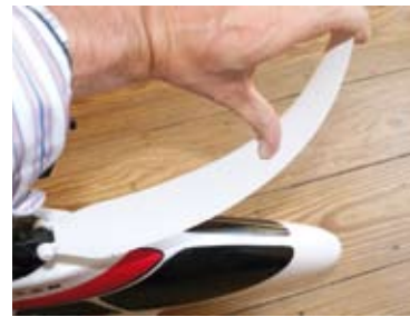
Nachgeben statt brechen ist auch bei den Rotorblättern selbst das Motto

also voll auf. Auch das Equipment ist passend ausgewählt. Das Heckrotor-Gyro-System erledigt einfach seine Aufgabe und der Motor ist nicht übermäßig stark, dafür sind Flüge von über 15 Minuten keine Seltenheit. Dann gebe ich mal den Sender weiter, denn seit dem Funcopter muss ich mich nicht nur um die Vorherrschaft der Fernsteuerung des Fernsehers behaupten. ■